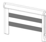
Modell 23 / 24